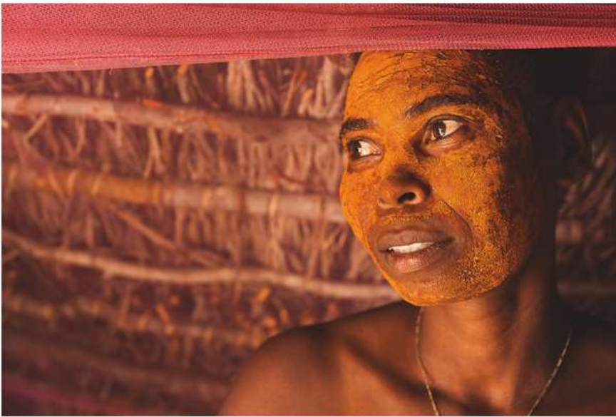
foto: © 2018 Cristina Mittermeier. All rights reserved. www.sealegacy.org - Yolanda, Berenty, Madagascar, January 2009

Het boek toont de twee series Enoughness en The Water's Edge . De eerste schetst de filosofie van Mittermeier voor een bewuste en duurzame manier van leven in de wereld. Het brengt foto's uit de meest afgelegen gebieden van de aarde samen, de wilde dieren, de landschappen en de inheemse volkeren. Mittermeier stelt materiële rijkdom aan de kaak door alternatieve oplossingen te laten zien die een betekenisvolle en duurzame connectie met onze omgeving, elkaar, en onszelf mogelijk maken.