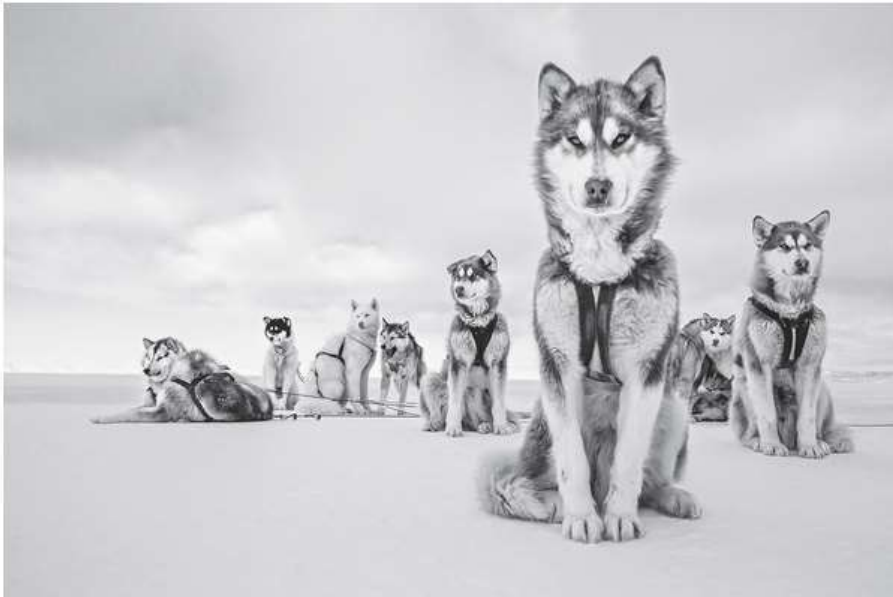
foto: © 2018 Cristina Mittermeier. All rights reserved. www.sealegacy.org - Alpha Dog, Greenlandic Huskies, Thule, Greenland, April 2015

Het boek toont de twee series Enoughness en The Water's Edge . De eerste schetst de filosofie van Mittermeier voor een bewuste en duurzame manier van leven in de wereld. Het brengt foto's uit de meest afgelegen gebieden van de aarde samen, de wilde dieren, de landschappen en de inheemse volkeren. Mittermeier stelt materiële rijkdom aan de kaak door alternatieve oplossingen te laten zien die een betekenisvolle en duurzame connectie met onze omgeving, elkaar, en onszelf mogelijk maken.