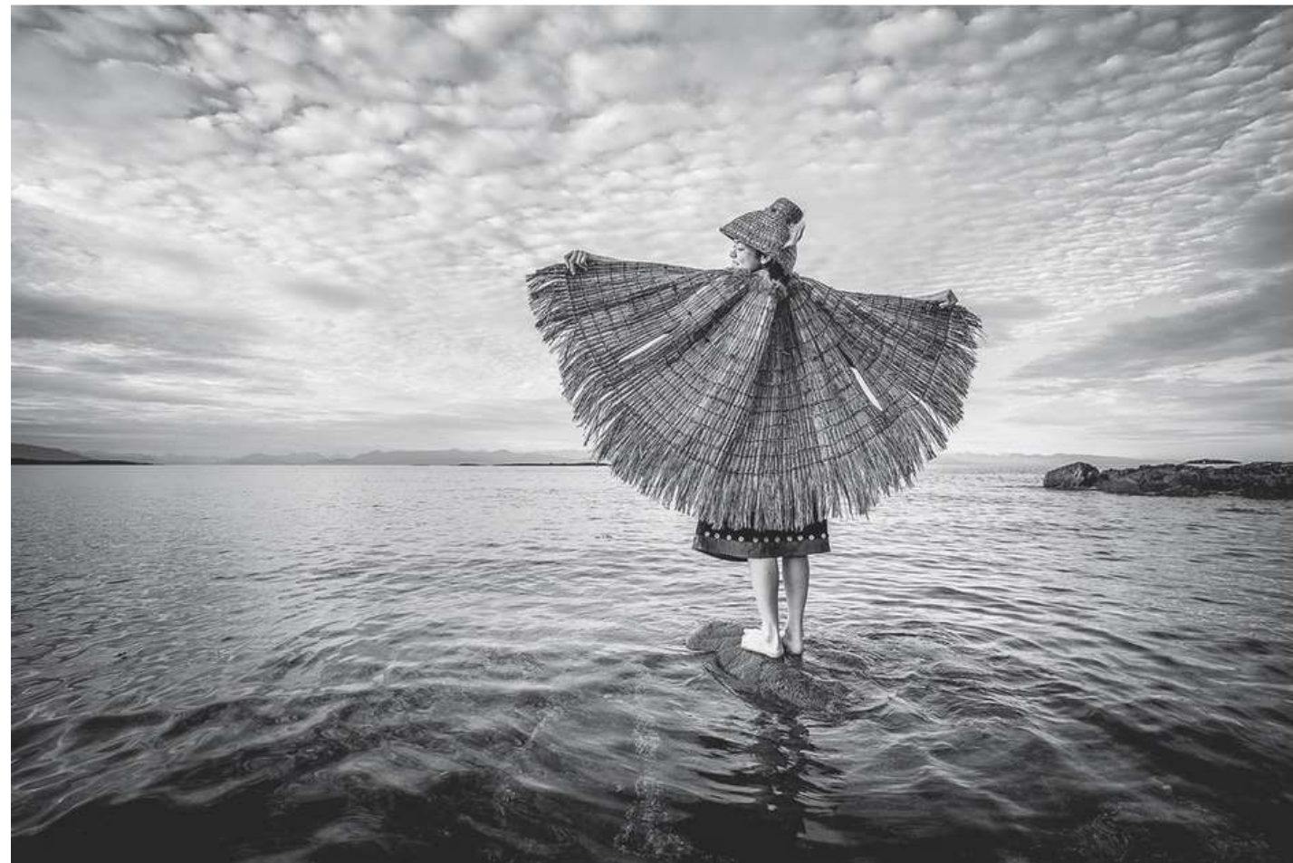
With Open Arms, Salish Sea, Vancouver Island, British Columbia, Canada, 2017

De uit Mexico City afkomstige Christina Mittermeier is opgeleid als zeebioloog en fotograaf. Zij combineert haar werk achter de lens met haar passie voor milieubewustzijn. Met haar fotografie zoekt zij overal ter wereld voornamelijk naar de relatie tussen de aarde en de oceaan en probeert ze de aandacht te vestigen op de schoonheid maar ook op de benarde toestand van onze planeet. Haar nieuwe fotoboek Amaze is een mooie verzameling van fantastische natuurfotografie en een inspiratie voor duurzaam leven.